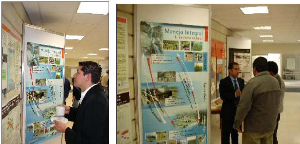
Figura 2. Presentación de pósters.

Contamos además con la proyección de dos videos que enmarcaron las temáticas principales: